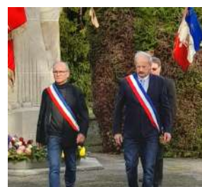
Les maires unis

Étaient également présents, le corps local des sapeurs-pompiers, les JSP, la gendarmerie et les scouts polonais.