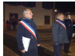
Les maires des 2 communes réunis