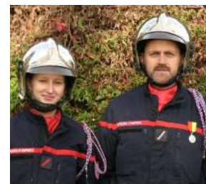
Elles ont su se donner toutes les chances pour réussir

Être pompier, c'est être des anges gardiens !