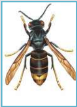
Reconnaître le frelon asiatique