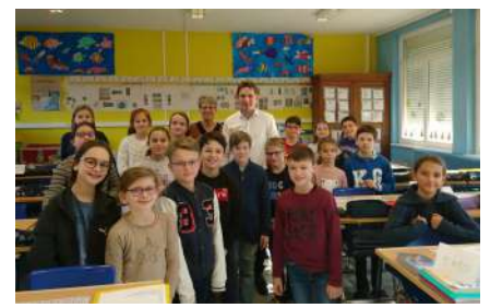
Classe de CM2 : Accueil du Député Raphaël SCHELLENBERGER