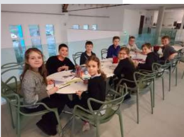
Visite de la Fondation Schneider à Wattwiller, le 28 janvier 2020

Mais je suis partagée entre deux intenses sentiments : le plaisir de vivre d'autres aventures et de devenir « propriétaire » de mon temps, et la tristesse de quitter une école et des enfants auxquels je suis très attachée.