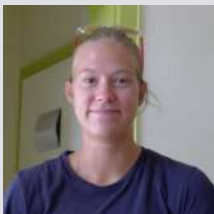
Opération « Job d'été »