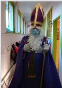
Saint Nicolas arrive !