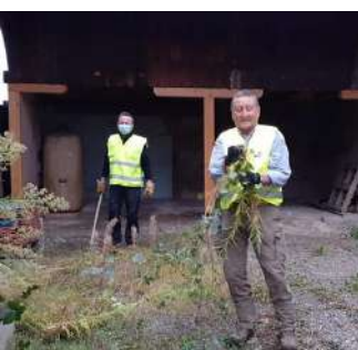
Labour derrière la mairie...