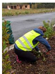
Une équipe active au Champ des Oiseaux