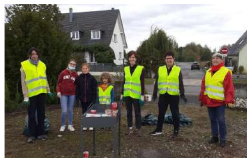
L'équipe de la Roselière