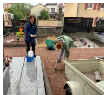
Entretien du cimetière