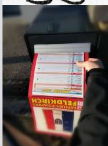
Le calendrier glissé dans vos boîtes aux lettres.