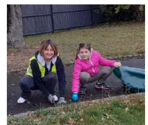
En famille sur les ronds-points