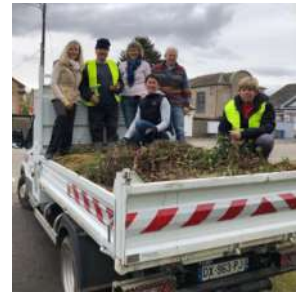
L'équipe joyeuse et motivée de la Cité Alex

La municipalité remercie tous les acteurs de cette matinée.