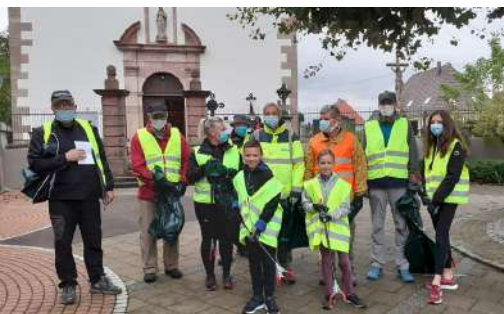
Les ramasseurs de déchets