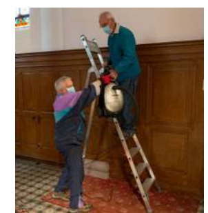
Besognes à l'église