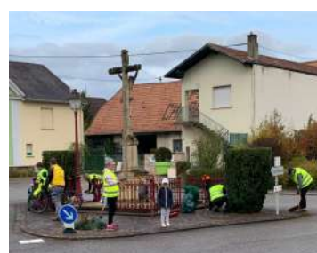
L'équipe espaces verts