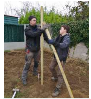
Mise en place des espaliers