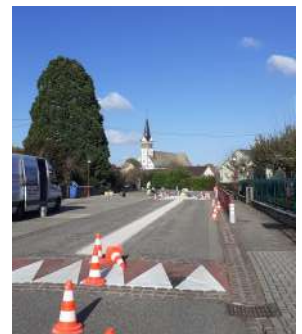
Les travaux ont été réalisés par la Société PROXIMARK.

D'autres travaux de réfection auront lieu à la prochaine journée citoyenne.