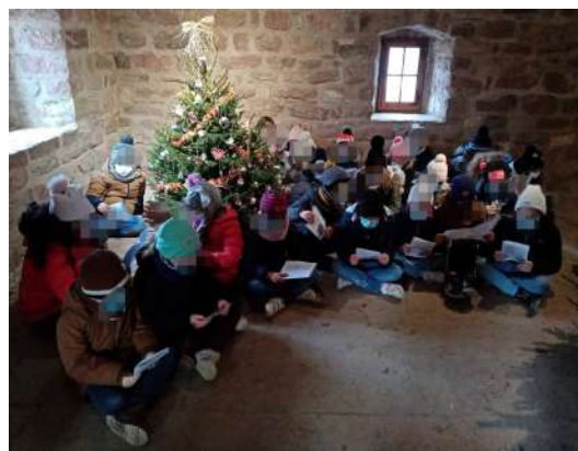
Les sapins seront exposés au musée de la maison de Sultz jusqu'au 2 janvier 2022 .

Les élèves se sont rendus à l'Écomusée le 3 décembre dernier pour décorer leur sapin et se sont vu offrir, chacun, une entrée gratuite au musée.