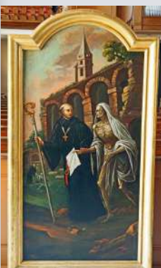
Autel de droite : St Fridolin et Urso, le mort « ressuscité ».