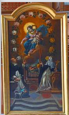
Autel de gauche : la remise de chapelet par la Vierge.

Beaucoup d'autres symboles sont représentés sur ce tableau qui mérite une visite guidée toujours possible.