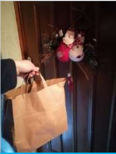
Portage à domicile, par les élus, du repas, des cadeaux et des cartes de vœux des écoliers.