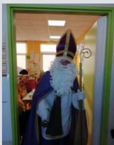
Saint-Nicolas était bienveillant avec les enfants !