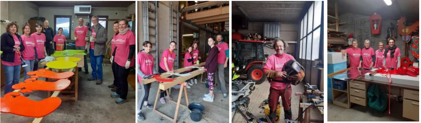
Les équipes de lutins ont préparé les décorations de Noël : réfection des paquets cadeaux, transformation des anciens décors et création de nouveaux décors pour agrémenter nos rues cet hiver !