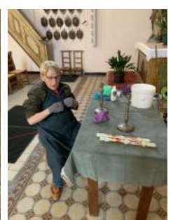
Nettoyage de l'église et rénovation de la crèche