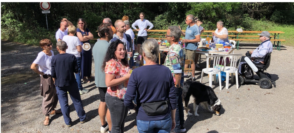
Le 07 septembre les riverains de la Cité Alex se sont réunis sous le soleil pour partager quelques victuailles.