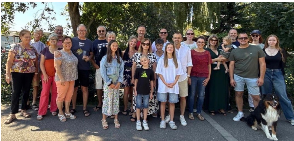
Le 24 août, ce sont les habitants du quartier Chemin du fossé qui se sont retrouvés autour d'une belle tablée.