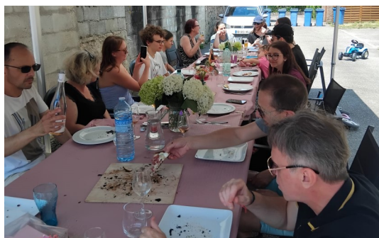
Le 14 juillet, quelques habitants de la rue principale se sont retrouvés autour de bonnes tartes flambées.